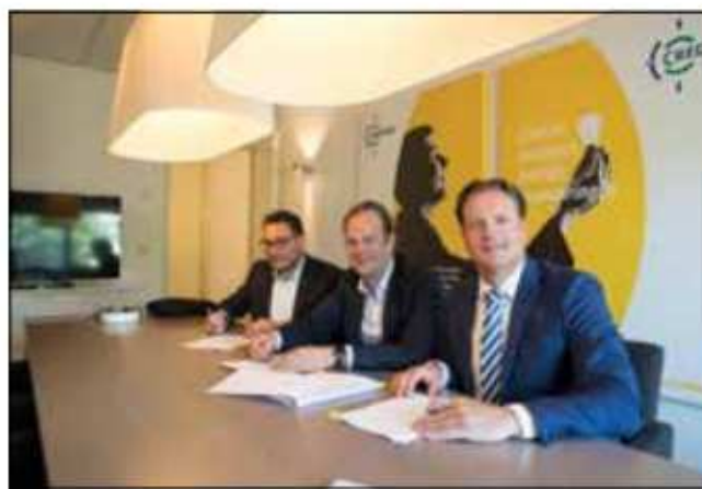
Ondertekening Credion overeenkomst bij Fidor